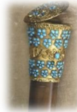
Canne aux turquoises, LeCointe, 1834.