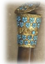
Canne aux turquoises, LeCointe, 1834, © Maison de Balzac / Roger-Viollet