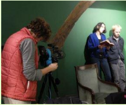
Veronique Aubouy © D.R.

L'atelier propose la création collective d'un film à partir de lectures à voix haute d'un roman de Balzac. Le film est intégralement fabriqué en une journée dans la Maison de Balzac.