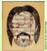
Balzac par Antonio Pinonniere

Balzac et les artistes Jusqu'au 2 octobre 2016