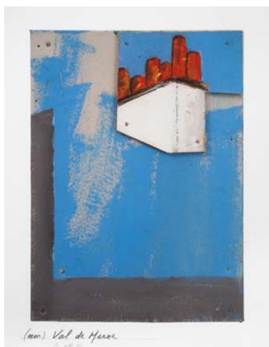
↑ (Mon) Val-de-Marne, 2017. Impression pigmentaire, studio Franck Bordas, 67 x 50 cm. Commande du Conseil départemental du Val-de-Marne. Collection Pierre Buraglio.