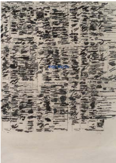
↑ Memento caviardé. Épigraphe. Ipsa facto , 1990. Sérigraphie, atelier Éric Seydoux, 100 x 68 cm. Collection Pierre Buraglio.