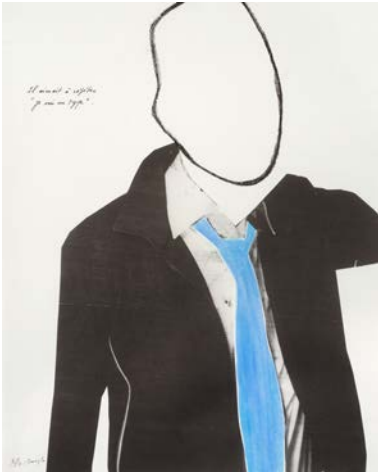
↑ BE. B./P.B. Suite Emmanuel Bove. Je suis un type , 2002. Lithographie rehaussée, impression Claude Buraglio, édition Catherine Putman, 50 x 40 cm. Collection Pierre Buraglio