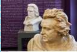
© Pierre Antoine Maison de Balzac