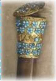
Canne aux turquoises, LeComte, 1834.