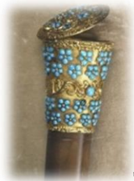
Canne aux turquoises, LeComte, 1834, © Maison de Balzac / Roger-Viollet